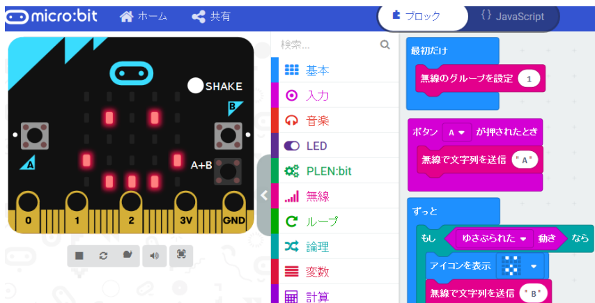
マイクロビットの開発画面

マイクロビットの使い方、プログラミング、センサー・通信の基礎について、実習を通して学ぶ講座です。